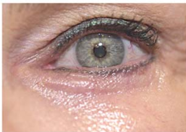
Olho esquerdo imediatamente após a aplicação do SkinRenu Intensive Serum W e Anti-Wrinkle Fineline Reducing Formula