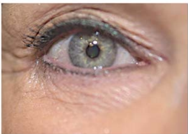
Olho direito não tratado