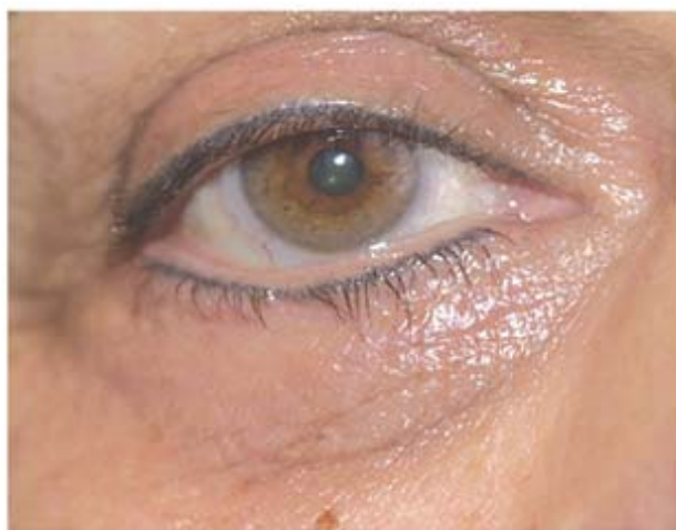
Após 45 dias de tratamento com SkinRenu Intensive Serum W e Anti-Wrinkle Fineline Reducing Formula